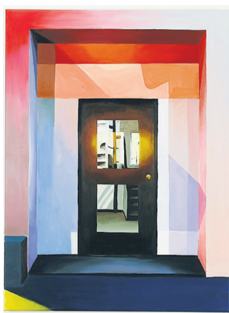
Remco Reijenga - Enter