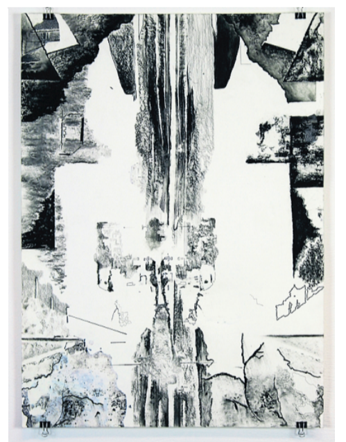
Joyce ter Weele - T#04