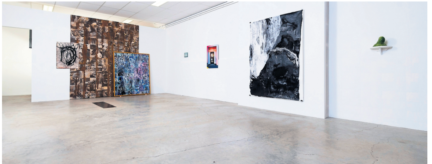
Overzicht van Melklokaal met werk van Allie van Altena, Remco Reijenga, Joyce ter Weele en Olger.

S tiekem zijn het misschien wel de leukste tentoonstellingen in het eigenge-reide Melklokaal in Heerenveen. In Milkshake , waarvan nu de derde editie wordt gepresenteerd, komt namelijk alles samen en de titel dekt de lading: het is lekker vers, vol en romig, eigentijds en fast en als je eruit komt ben je verzadigd.